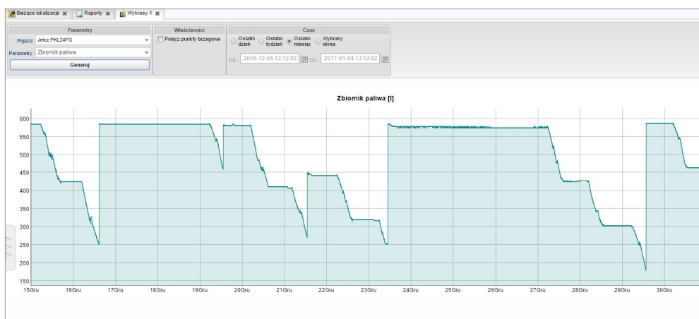
Przykładowy wykres - zużycia paliwa